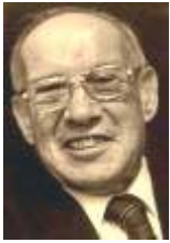
Peter F. Drucker

Wegens zijn groot 'succes' worden Rick Warrens boeken en methoden de modernste manier om als kerk werkzaam te zijn. Velen die hun grenzen zoeken te verleggen gebruiken deze gechristianiseerde handelsstrategieën om zich een megakerk te bouwen.