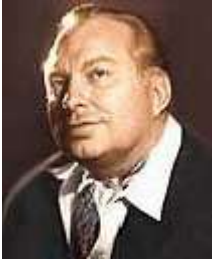
L. Ron Hubbard