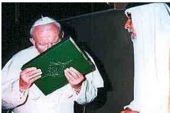
De paus kust de Koran, in mei 1999

Alle Schriftaanhalingen komen uit de Statenvertaling 1977. Vertaling, plaatjes en voetnoten door M.V.