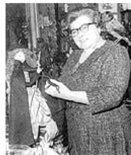
Sybil Leek 9 1923 - 1983

Ik zou het ene voorbeeld na het andere kunnen geven van de OCCULTE connectie met reflexologie en de andere in onderling verband staande methoden. Maar ik zal besluiten met slechts één bijkomend voorbeeld, van een welbekende HEKS: Sybil Leek. Zij wordt “de meesteres van het OCCULTE” genoemd en verklaart dat het Taoïsme - een op het occulte gebaseerde Chinese religie - sterk leunt op de yin-yang theorie. Zij zegt ook dat de yin-yang theorie “een idee [is] dat zulke dingen inspireerde als Chinees boksen, adembeheersing [toegepast in yoga, meditatie, enz.], het gebruik van bijzondere kruiden, en sommige eerder exotische seksuele oefeningen die ontwikkeld werden op de Yang met de Yin te voeden”.