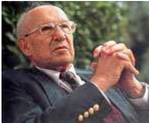
Peter F. Drucker