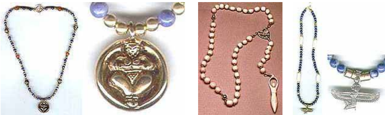
'Paternosters' in de godin-aanbidding. Zie: Rozenkrans

De geloofwaardigheid van de godin-aanbidding heeft een vlucht genomen door de acceptatie ervan door professoren en haar opname in leerboeken. Wicca-doctrines worden gepromoot met publiciteitsfondsen van erkende colleges en universiteiten. [16]