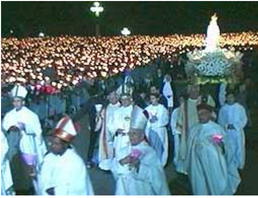
De processie in Fatima zet in

“Gij zult u geen gesneden beeld, noch enige gelijkenis maken, [van hetgeen] boven in de hemel is, noch [van hetgeen] onder op de aarde is, noch [van hetgeen] in de wateren onder de aarde is. Gij zult u voor die niet buigen, noch hen dienen; want Ik, de HEERE uw God, ben een ijverig God, Die de misdaad der vaders bezoek aan de kinderen, aan het derde, en aan het vierde [lid] dergenen, die Mij haten” - Het tweede gebod, dat de Roomse kerk heeft weggelaten: Exodus 20:4-5.