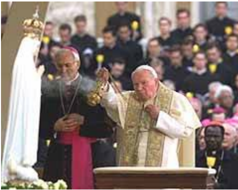
Wierook voor het Mariabeeld van Fatima

Miljoenen pelgrims gaan naar de heiligdommen die gewijd zijn aan de verschijningen van Maria. Elk jaar gaan 15 tot 20 miljoen pelgrims naar Guadalupe in Mexico, 5,5 miljoen naar Lourdes, 5 miljoen gaan naar Czestochowa (Jasna Gora) in Polen, en 4,5 miljoen naar Fatima in Portugal. Speciale datums brengen grote massa's bijeen. Op 15 augustus een half miljoen pelgrims naar Czestochowa. Op 13 oktober een miljoen mensen naar Fatima. Op 12 december 1999 gingen er 5 miljoen pelgrims naar Mexico om er 'O.L.V. van Guadalupe' te eren. [29]