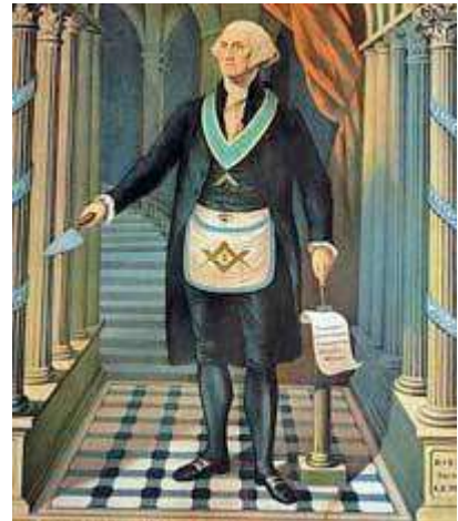
George Washington als vrijmetselaar

Samenvatting: 11 vrijmetselaars, 3 mogelijke vrijmetselaars, 1 humanist, 2 verdedigers van vrijmetselarij, 4 geen bewijs van connecties.