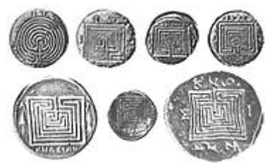
Diverse labyrinten - rechts: op munten uit Kreta