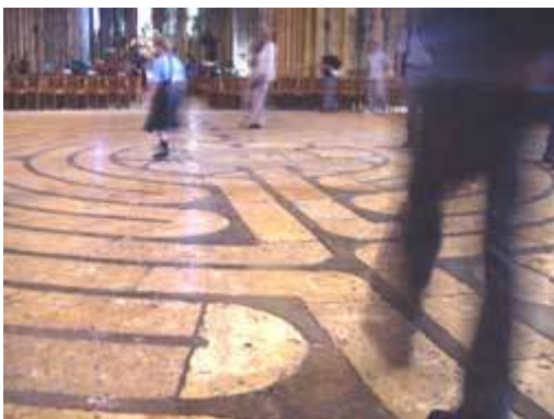
Het labyrint in de kathedraal van Chartres