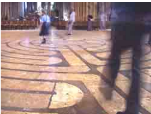
Het labyrint in de kathedraal van Chartres