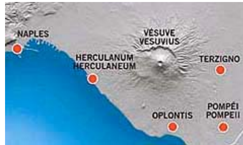
De Baai van Napels

Welke visie ook: wij hebben hier een vroeg getuigenis van het kruis als symbool van het Christendom. (M.V.)