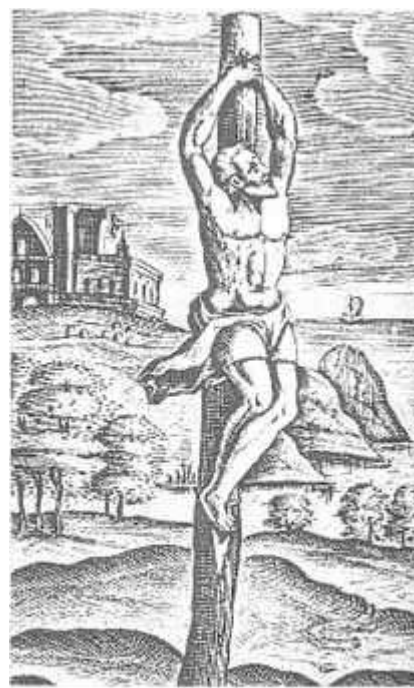
The crux simplex as illustrated by the Roman Catholic scholar Justus Lipsius

“Er waren reeds christenen gevestigd in Puteoli 2 [kort bij Napels] - Paulus’ reputatie is hem daar al voorafgegaan ... Van deze vroege congregatie kan het geloof uitgebreid zijn rond de Baai van Napels, omdat er kort nadien christenen waren nabij Herculaneum. Eén van de huizen van deze toevluchtstad, dat vandaag bevrijd werd vanonder zijn lavabedekking van de berg Vesuvius, toont duidelijk de contouren van een metalen kruis dat aan de wand was