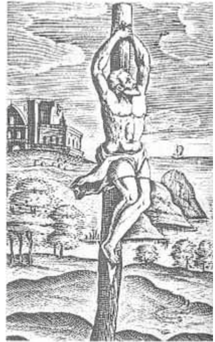
The crux simplex as illustrated by the Roman Catholic scholar Justus Lipsius

Het boekwerk, een Latijns werk dat nog moeilijk te vinden is, bezit verscheidene houtsnede-illustraties van het palen of kruisigen. Veruit de meeste illustraties beelden niet een man op een staak af, maar een opgerichte staak met daaraan een kruisbalk - met andere woorden: een kruis.