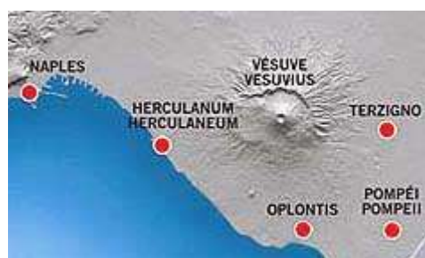
De Baai van Napels

Welke visie ook: wij hebben hier een vroeg getuigenis van het kruis als symbool van het Christendom. (M.V.)