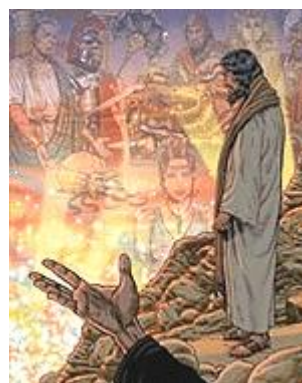
Satans macht over de wereld

“En daarna bracht de duivel Hem op een hoge berg en liet Hem in een ogenblik tijd al de koninkrijken van de wereld [Gr. oikumene ] zien. En de duivel zei tegen Hem: Ik zal U al deze macht en de heerlijkheid van deze koninkrijken geven, want die is aan mij overgegeven en ik geef die aan wie ik maar wil; dus, als U mij zult aanbidden, zal het allemaal van U zijn”.