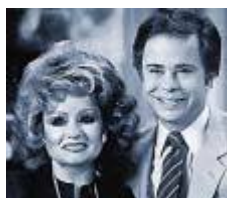
Jim & Tammy Bakker

"Daarom heb ik een welbehagen in zwakheden, in smaadheden, in noden, in vervolgingen, in benauwdheden, om Christus' wil; want als ik zwak ben, dan ben ik machtig" - 2 Kor. 12:10