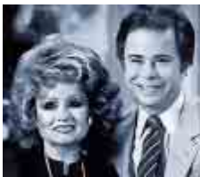
Jim & Tammy Bakker

“Daarom heb ik een welbehagen in zwakheden, in smaadheden, in noden, in vervolgingen, in benauwdheden, om Christus’ wil; want als ik zwak ben, dan ben ik machtig” - 2 Kor. 12:10