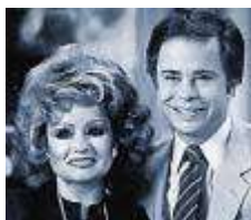
Jim & Tammy Bakker

"Daarom heb ik een welbehagen in zwakheden, in smaadheden, in noden, in vervolgingen, in benauwdheden, om Christus' wil; want als ik zwak ben, dan ben ik machtig" - 2 Kor. 12:10