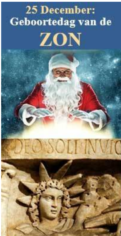
De Onoverwinnelijke Zonnegod DEO SOLI INVICTO oftewel MITHRAS

Heidense rituelen en afgoden kregen christelijke namen, bv. Jezus Christus als de “Zon der Gerechtigheid” (Maleachi 4:2) verving hun zonnegod Deo Sol Invictus (Onoverwinnelijke Zon). Als we elementen uit het heidendom christianiseren, dan bouwen wij in feite mee aan een fusiereligie . De