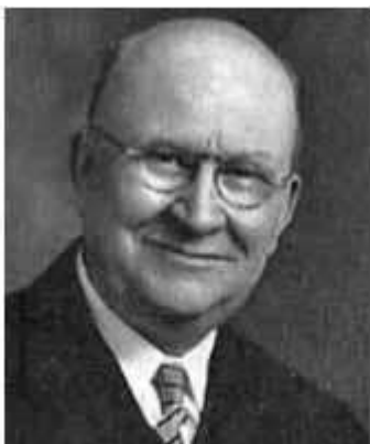
Harry A. Ironside, 1876-1951

Mijn moeder, weduwe, was volgens mij een uit de duizend. Ik herinner me nog hoe opgewonden ik was toen ze met mij als kind knielde en bad: “O Vader, voorkom dat mijn jongen ooit iets groters verlangt dan voor U te leven. Red hem vroeg en maak van hem een toegewijde straatprediker, zoals zijn vader was. Maak hem bereid om te lijden omwille van Jezus, om met genoeg vervolging en afwijzing te doorstaan door de wereld die Uw Zoon heeft verstoten, en behoed hem voor wat U oneer aan zou doen”. De woorden waren niet altijd dezelfde, maar ik heb de sentimenten talloze malen gehoord.