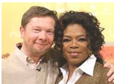
Eckhart Tolle & Oprah Winfrey

propagandist Oprah Winfrey. Maar ik wil in dit artikel de volgende vraag behandelen: “Leert de Bijbel ook maar ergens dat de mens God is?”