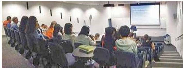
Studenten aan de Universiteit van Adelaide, Zuid-Australië, op een voordracht door de auteur