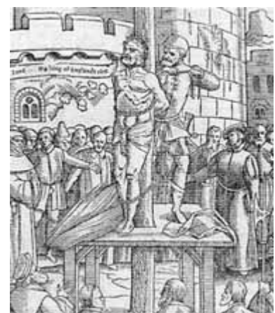
William Tyndale sterft op de brandstapel in 1536, te Vilvoorde

BELIJDENIS, niet in het oor van een priester, want dat is slechts een menselijke uitvinding, maar tot God in het hart, en voor de hele vergadering van God; hoe wij zondaars en zondig zijn, en dat onze hele natuur corrupt is, en geneigd tot zonde en alle ongerechtigheid, en daarom boos is, slecht en vervloekt; maar Zijn Wet is heilig en rechtvaardig, bij dewelke onze zondige natuur wordt weersproken: en ook tegen onze naasten, als wij iemand in het