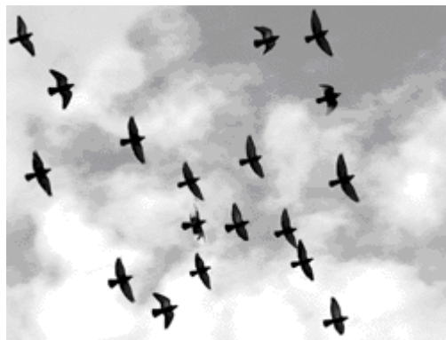
De eerste hemel: de lucht

Het is ook in de lucht dat de duivel (evenwel onzichtbaar) werkzaam is (samen met zijn demonen): “de overste van de macht der lucht (Grieks: aeros ), van de geest , die nu werkt in de kinderen der ongehoorzaamheid” (Efeziërs 2:2; vergelijk 6:12).