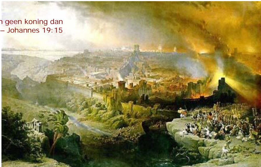
Met de verwoesting van Jeruzalem in 70 n.C. kwam een eind aan de natie Israël

“Wij hebben geen koning dan de keizer!” – Johannes 19:15