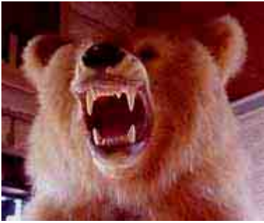
Beren hebben tanden als katachtigen

die moesten dienen om dieren aan te vallen. Maar louter omdat een dier grote scherpe tanden bezit betekent niet dat het een vleeseter is. Het betekent enkel dat hij grote scherpe tanden heeft! (34)