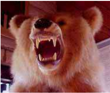
Beren hebben tanden als katachtigen

die moesten dienen om dieren aan te vallen. Maar louter omdat een dier grote scherpe tanden bezit betekent niet dat het een vleeseter is. Het betekent enkel dat hij grote scherpe tanden heeft! (34)