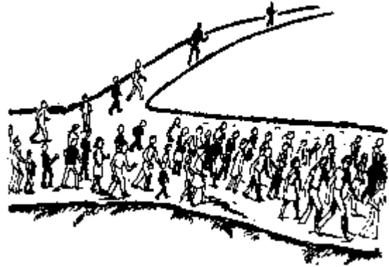
De brede weg zal altijd het drukste verkeer dragen

Het helpt niet om de onrealistische verwachtingen te koesteren dat hele steden of zelfs hele landen zich in zak en as tot God zullen bekeren en zodoende een totale transformatie naar christelijke standaarden zullen ondergaan. Strategische geestelijke oorlogvoering en boze machten in de lucht proberen neer te werpen is onbijbels, onuitvoerbaar en schept valse verwachtingen. Wij moeten eerder aanvaarden dat er in de eindtijd zware tijden over de aarde zullen komen (2 Timotheüs 3:1), en uiteindelijk een grote verdrukking “zoals er niet geweest is vanaf het begin van de wereld, tot nu toe, en zoals er ook nooit meer zijn zal” (Mattheüs 24:21). Dit scenario staat op het punt om vervuld te worden.