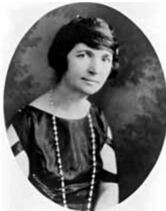
Margaret Sanger 3 , in 1922, de oprichtster van Planned Parenthood 4 , was verstrengeld met nazi-Duitse eugenetici.