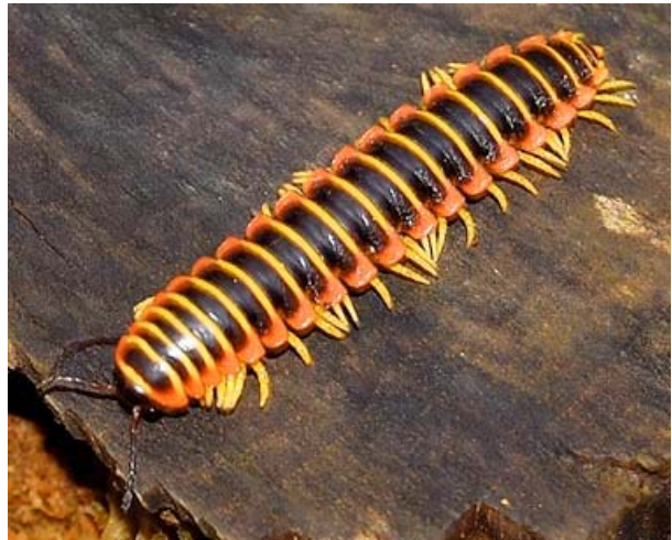
Apheloria Virginiana 1

Maar er bestaat een soort van duizendpoot, met de naam Apheloria , die dit gewoon doet. Apheloria heeft, op elk segment van zijn lichaam, speciale klieren die een chemische stof produceren die nodig is als afweersysteem. Wanneer de duizendpoot door een vijand wordt aangevallen, dan mixt hij deze chemische stof met een katalysator. Het resultaat is een samenstelling die bestaat uit milde irritantia plus waterstofcyanidegas: dezelfde dodelijke chemische stof die in de gaskamer wordt gebruikt. Bij dit afweersysteem zullen zowel de duizendpoot als zijn vijanden gehuld worden in een wolk van dodelijk cyanidegas. Zijn aanvallers sterft, maar de duizendpoot wandelt gewoon weg, zonder enig letsel.