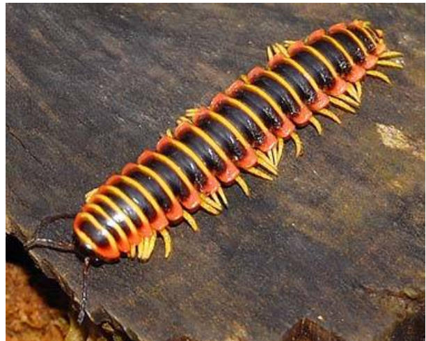
Apheloria Virginiensis 1

Maar er bestaat een soort van duizendpoot, met de naam Apheloria , die dit gewoon doet. Apheloria heeft, op elk segment van zijn lichaam, speciale klieren die een chemische stof produceren die nodig is als afweersysteem. Wanneer de duizendpoot door een vijand wordt aangevallen, dan mixt hij deze chemische stof met een katalysator. Het resultaat is een samenstelling die bestaat uit milde irritantia plus waterstofcyanidegas: dezelfde dodelijke chemische stof die in de gaskamer wordt gebruikt. Bij dit afweersysteem zullen zowel de duizendpoot als zijn vijanden gehuld worden in een wolk van dodelijk cyanidegas. Zijn aanvaller sterft, maar de duizendpoot wandelt gewoon weg, zonder enig letsel.