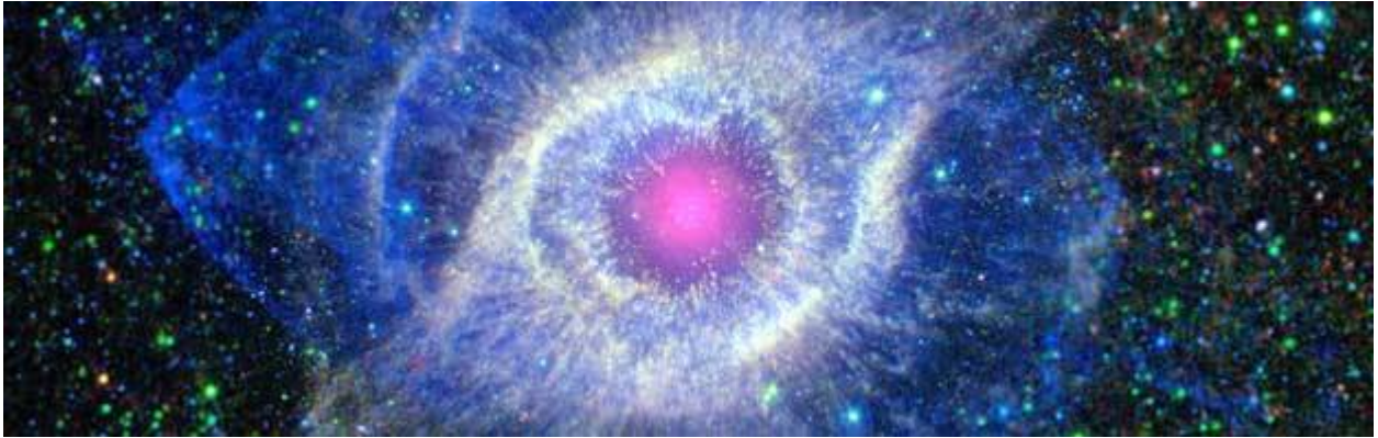
Helixnevel (Helix Nebula image by NASA/JPL-Caltech)

Alle Schriftaanhalingen komen uit de Statenvertaling (1977 of HSV) Vertaling door M.V.