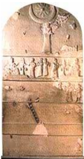
Stèle van Ur-Nammu

In het oude Syrië en Kanaän werd de maangod Sin gewoonlijk afgebeeld door de maan in zijn eerste fase. Soms werd de volle maan binnen de maansikkel geplaatst om alle fazen van de maan te benadrukken. De sterren waren de dochters van Sin. Zo was bvb. Ishtar de dochter van Sin. Offers aan de maangod worden beschreven in de Pas Shamra teksten. In de Ugaritische teksten wordt de maangod soms Kusuh genoemd. In Perzië, zowel als in Egypte, wordt de maangod afgebeeld op muurschilderingen en op de hoofden van beelden. Hij was de Rechter van mensen en goden. Het Oude Testament berispt voortdurend tegen de aanbidding van o.a. de maangod (zie: Deut 4:19; 17:3; 2 Kon 21:3,5; 23:5; Jer 8:2; 19:13; Zef 1:5, enz.). Eigenlijk kan overal in de oude wereld het symbool van de maansikkel gevonden worden op zegelindrukken, stèles, aardewerk, amuletten, kleitabletten, cilinders, gewichten, oorkingen, halsnoeren, muren, enz. In Tell-el-Obeid werd er een koperen kalf gevonden met een maansikkel op zijn voorhoofd. Een afgod met het lichaam van een stier en het hoofd van een man heeft een maansikkel-inleg van schelpen op zijn voorhoofd.