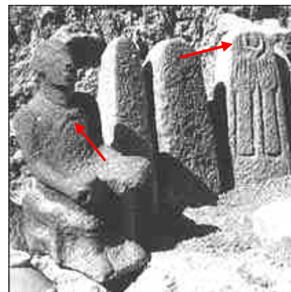
Tempel van de maangod in Hazor, met maansikkel op de borst en op de stèle

In Ur werd een tempel van de maangod opgegraven door Sir Leonard Woolley. Vele voorbeelden van maanaanbidding werden opgegraven en die zijn ondergebracht in het Brits Museum tot op vandaag. Ook Haran (of Harran) stond bekend voor zijn aanbidding van de maangod.