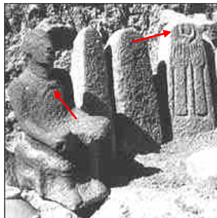
Tempel van de maangod in Hazor, met maansikkel op de borst en op de stèle

In Ur werd een tempel van de maangod opgegraven door Sir Leonard Woolley. Vele voorbeelden van maanaanbidding werden opgegraven en die zijn ondergebracht in het Brits Museum tot op vandaag. Ook Haran (of Harran) stond bekend voor zijn aanbidding van de maangod.