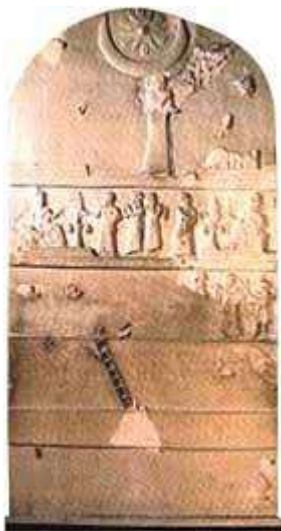
Stèle van Ur-Nammu

In het oude Syrië en Kanaän werd de maangod Sin gewoonlijk afgebeeld door de maan in zijn eerste fase. Soms werd de volle maan binnen de maansikkel geplaatst om alle fazen van de maan te benadrukken. De sterren waren de dochters van Sin. Zo was bvb. Ishtar de dochter van Sin. Offers aan de maangod worden beschreven in de Pas Shamra teksten. In de Ugaritische teksten wordt de maangod soms Kusuh genoemd. In Perzië, zowel als in Egypte, wordt de maangod afgebeeld op muurschilderingen en op de hoofden van beelden. Hij was de Rechter van mensen en goden. Het Oude Testament berispt voortdurend tegen de aanbidding van o.a. de maangod (zie: Deut 4:19; 17:3; 2 Kon 21:3,5; 23:5; Jer 8:2; 19:13; Zef 1:5, enz.). Eigenlijk kan overal in de oude wereld het symbool van de maansikkel gevonden worden op zegelindrukken, stèles, aardewerk, amuletten, kleitabletten, cilinders, gewichten, oorkingen, halsnoeren, muren, enz. In Tell-el-Obeid werd er een koperen kalf gevonden met een maansikkel op zijn voorhoofd. Een afgod met het lichaam van een stier en het hoofd van een man heeft een maansikkel-inleg van schelpen op zijn voorhoofd.