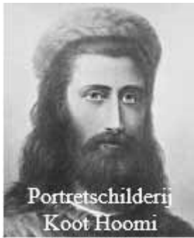
Portret schilderij Koot Hoomi

Ze groeide op in een rijk Anglicaans gezin, maar voelde zich ellendig en probeerde drie keer zelfmoord te plegen voordat ze 15 was. Naar verluidt was het op deze leeftijd dat ze op 30 juni 1895 voor het eerst haar geestmeester ontmoette, “een lange man, gekleed in Europese kleding en met een tulband”. Later identificeerde ze hem als de “Meester” Koot Hoomi 1 met wie Madame Blavatsky naar verluidt communiceerde.