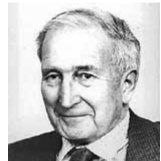
De notoire atheïst die zijn mening veranderde, Antony Flew

“Het lijkt me nu zo dat de bevindingen van meer dan vijftig jaar van DNA-onderzoek hebben voorzien in stof voor een nieuw en enorm krachtig argument voor design”. [11]