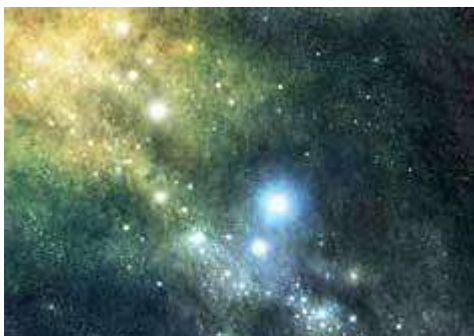
De Bijbel zegt ons dat God de sterren maakte op de vierde dag van de scheppingsweek

Volgens de big bang – ‘the only game in town’ om de oorsprong van de sterren te verklaren – moeten er twee fases van sterrenformatie geweest zijn. Fase 1 betrof de formatie van waterstof/helium sterren (die Populatie III sterren [7] genoemd worden). Hier is het eerste probleem: hoe krijg je gasen gevormd in een snel expanderend primordiaal universum om samen te smelten om zo een kritische massa te vormen opdat er genoeg gravitatie is om meer gas aan te trekken om te groeien tot een ster? Gassen neigen er niet toe om samen te komen; ze verspreiden zich, in het bijzonder daar waar er een grote hoeveelheid energie (hitte) is.[8] Kosmologen vonden ‘donkere materie’ uit, wat een onzichtbare, niet te detecteren ‘materiaal’ is dat gewoon veel gravitationele aantrekkingskracht genereert, precies waar het nodig is. Nog meer magie![9]