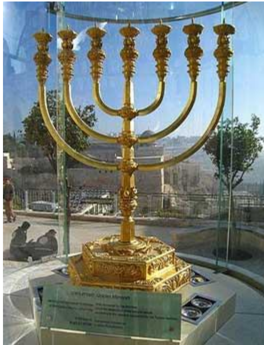
Gouden menorah van het Tempelinstituut voor de Derde Tempel tegenover de Tempelberg Zie de slideshow: http://www.templeinstitute.org/moving-menorah-2.htm

In 1986 werd het Tempelinstituut gesticht met als objectief de "Herbouw van de Heilige Tempel op Berg Moria in Jeruzalem". Zij bouwen "de tempel in afwachting" door het voorbereiden van architecturale ontwerpen en het construeren van de attributen die gebruikt moeten worden in de nieuwe Tempel. Aan een hoge prijs (er werd tot dusver 20 miljoen dollar gedoneerd) en gebaseerd op intensief onderzoek hebben zij de gewaden van de hogepriester afgewerkt, inbegrepen de gouden kroon en de borstplaat met zijn 12 kostbare stenen, met daarin gegraveerd de stammen van Israël; een koperen wasbekken; een wierookaltaar; zilveren trompetten; met goud en zilver beklede sjofars; harpen; en vele andere dingen. Levitische priesters worden zelfs opgeleid. Van bijzonder belang is de grote menorah die geconstrueerd werd met 95 pounds (of 43 kg) zuiver goud, met een waarde van 2 miljoen dollar.