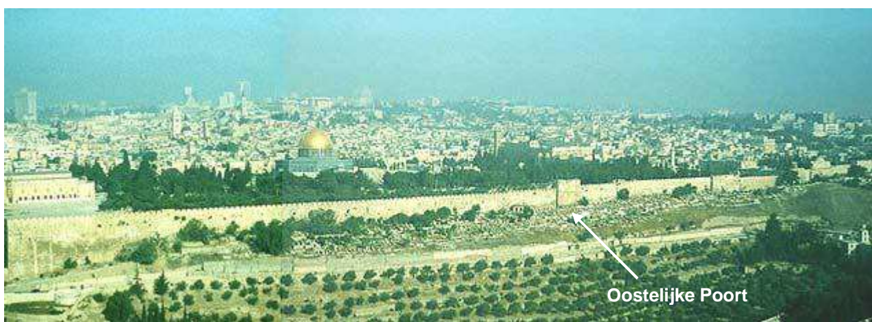
De Oostelijke Muur vandaag, met de Rotskoepel of Omarmoskee. Toen de bouw van de Rotskoepel begon, in 685, stond op die plek een door kalief Omar gebouwde kleine houten moskee.

In augustus 1967 waarschuwde het Opperste Rabbinaat van Israël de Joden “van niet enig gedeelte van de Tempelberg binnen te gaan”. Het volgende bord staat nog steeds bij de ingang van de Tempelberg op gezag van de leidende rabbi's: “AANDACHT EN WAARSCHUWING: Het gebied van de Tempelberg binnengaan is verboden door de Joodse Wet gezien de heiligheid van de plaats”. Dit is gebaseerd op hun eigen bijgelovige vrees dat iemand wel eens zou kunnen treden op de plaats waar eens het Heilige der Heiligen stond. Zij zeggen ook dat er vandaag geen mogelijkheid is tot reiniging vermits het zuiverende water, met de as van een rode vaars, niet bestaat. Er is hierover echter geen consensus. Andere rabbi's hebben de Joden aangemoedigd bepaalde delen van de Tempelberg te bezoeken na zich te baden in een mikva (een bad voor ceremoniële onderdompeling).