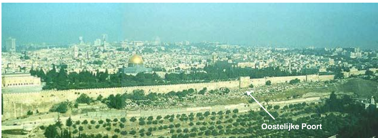
De Oostelijke Muur vandaag, met de Rotskoepel of Omarmoskee. Toen de bouw van de Rotskoepel begon, in 685, stond op die plek een door kalief Omar gebouwde kleine houten moskee.

In augustus 1967 waarschuwde het Opperste Rabbinaat van Israël de Joden “van niet enig gedeelte van de Tempelberg binnen te gaan”. Het volgende bord staat nog steeds bij de ingang van de Tempelberg op gezag van de leidende rabbi's: “AANDACHT EN WAARSCHUWING: Het gebied van de Tempelberg binnengaan is verboden door de Joodse Wet gezien de heiligheid van de plaats”. Dit is gebaseerd op hun eigen bijgelovige vrees dat iemand wel eens zou kunnen treden op de plaats waar eens het Heilige der Heiligen stond. Zij zeggen ook dat er vandaag geen mogelijkheid is tot reiniging vermits het zuiverende water, met de as van een rode vaars, niet bestaat. Er is hierover echter geen consensus. Andere rabbi's hebben de Joden aangemoedigd bepaalde delen van de Tempelberg te bezoeken na zich te baden in een mikva (een bad voor ceremoniële onderdompeling).