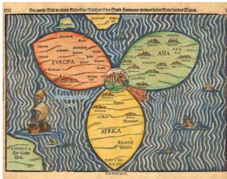
Kaart in klaverbladmodel uit 1581 met Jeruzalem als centrum van de wereld!

Het verhaal van de natie Israël is grotendeels het verhaal van de Tempelberg, en het zou iedere gelovige moeten interesseren, want dit is het hart van bijbelse profetie en onze eigen toekomst is eraan opgehangen.