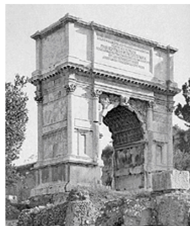
De Titusboog in Rome staat er nog steeds, na bijna 2000 jaar. Aan de binnenkant van de boog is er een afbeelding over de verwoesting van Jeruzalem door Titus en het wegdragen van de Tempelartefacts.

In 82 nC werd de Titusboog in Rome opgericht om de verwoesting van Jeruzalem te vieren. Hij werd gebouwd door keizer Domitianus ter ere van zijn oudere broer Titus, die het Romeinse 10 de Legioen had geleid tegen Jeruzalem en die nadien keizer werd. De triomfboog geeft Titus weer als “goddelijk”. Aan de binnenkant van de boog zijn er afbeeldingen van de artefacts uit de Tempel, met inbegrip van de menorah en de zilveren trompetten.