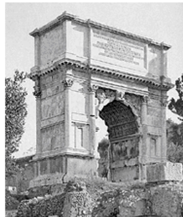
De Titusboog in Rome staat er nog steeds, na bijna 2000 jaar. Aan de binnenkant van de boog is er een afbeelding over de verwoesting van Jeruzalem door Titus en het wegdragen van de Tempelartefacts.

In 82 nC werd de Titusboog in Rome opgericht om de verwoesting van Jeruzalem te vieren. Hij werd gebouwd door keizer Domitianus ter ere van zijn oudere broer Titus, die het Romeinse 10 de Legioen had geleid tegen Jeruzalem en die nadien keizer werd. De triomfboog geeft Titus weer als “goddelijk”. Aan de binnenkant van de boog zijn er afbeeldingen van de artefacts uit de Tempel, met inbegrip van de menorah en de zilveren trompetten.