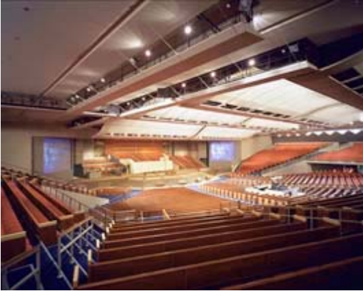
De "Potter's House" mega-kerk van T.D. Jakes

In dit kort artikel geef ik slechts een korte lijst uit de vele Oneness Pentecostal dwalingen. Voor meer gedetailleerde informatie kan de lezer op de link klikken aan het begin van dit artikel en terugblikken naar het excellente materiaal over deze sekte van CARM. [Of zie de links achteraan].