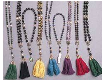
Verschillende types: 27, 54 en 108 kralen

“Godin van Genade” Kuan Yin vergeleken met haar versie van Rome