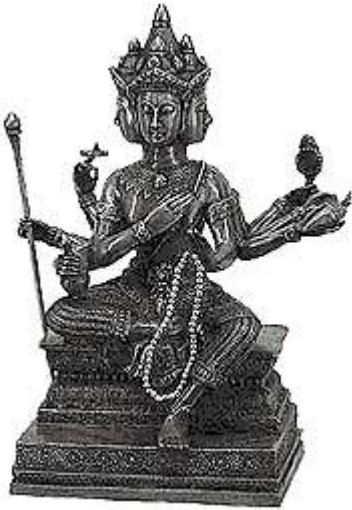
Brahma met mala