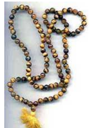
108 Kralen mala