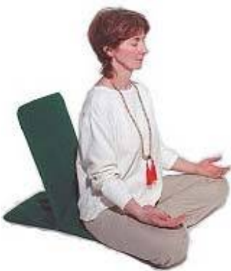
Mala die gebruikt wordt bij de Yogabeoefening