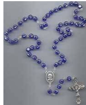
Pater Pio rozenkrans