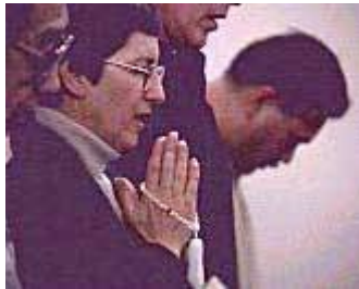
Boeddhistisch gebed met rozenkrans