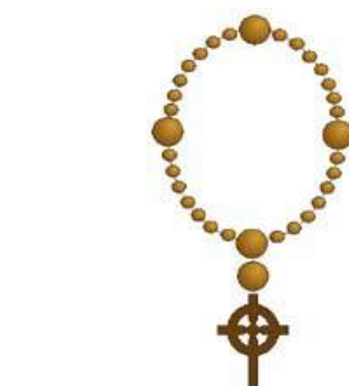
Klassiek model van een Anglicaanse “rosary”