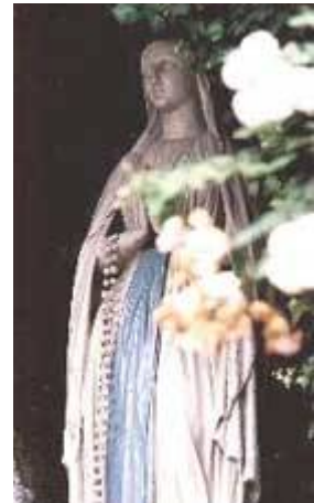
“OLV van Lourdes” met rozenkrans

Maria als ‘genadeschenkster’ had haar voorlopers: K/Q/Guan-Yin (Oost-Azië), Kannon en Yuki (Japan), Kwun-Yam, enz. - zij worden allen ‘Godin van de Genade’ genoemd.