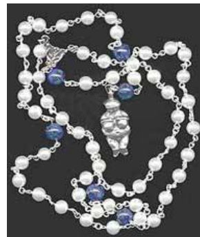
“Onze Moeder” rozenkrans