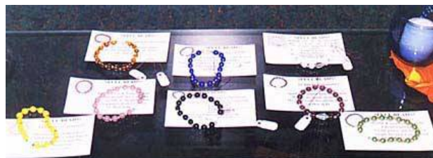
Rozenkransen voor de waarzeggerij