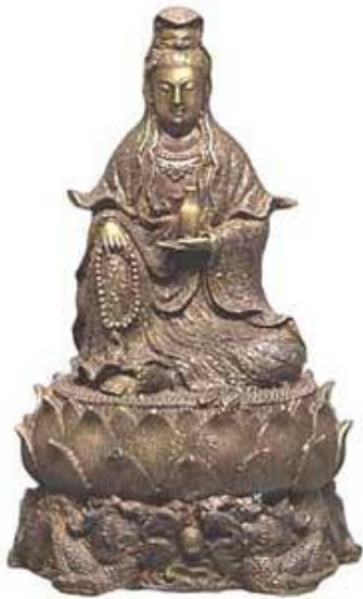
Kuan Yin met haar rozenkrans

“Godin van Genade” Kuan Yin vergeleken met haar versie van Rome