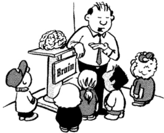
De evolutionistische leraar biologie:

Illustratie: De jungle-inboorling is wijs genoeg om te weten dat degene die iets maakt groter is dan het gemaakte voorwerp. Wat doet hij? Hij kapt een boom en met een deel ervan maakt hij een kano. Hij weet dat hij als maker van de kano groter is dan de kano. Daarna gebruikt hij de rest van dezelfde boom om er een afgod van te maken en hij aanbidt die! In plaats daarvan had hij moeten uitroepen in zijn hart: “Ik wil Degene kennen die deze boom en deze wereld maakte!” God eert een zoekend hart (Jeremia 29:13; Hebreëen 11:6)!