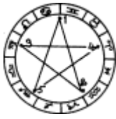
Pentagram met zodiak

Wicca, Satanskerk en Vrijmetselarij, die tamelijk recente stromingen lijken te zijn maar in feite zeer oude duivelse wortels hebben in Mesopotamië.