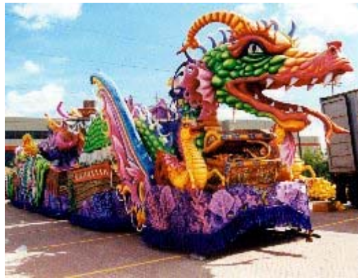
De Leviathan leeft verder in de overlevering, zoals in China

Dinosauriërachtigen die rook en vonken spuwden hebben echt bestaan, en de Leviathan (een zeedraak) is er zo een. Job is het oudste boek van de Bijbel en toont aan dat de mens in die tijd deze machtige dieren nog heeft gekend . Daarnaast bewijst de bombardeerkever, die in onze tijd leeft, dat het in de schepping biologisch mogelijk is dat dieren "rook en vuur" spuwen. Zodoende kunnen wetenschappers ook het verhaal in Job over de vurige Leviathan, beter ernstig nemen.