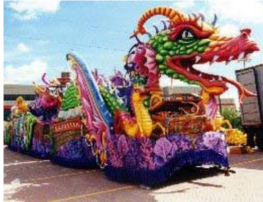
De Leviathan leeft verder in de overlevering, zoals in China

Dinosauriërachtigen die rook en vonken spuwden hebben echt bestaan, en de Leviathan (een zeedraak) is er zo een. Job is het oudste boek van de Bijbel en toont aan dat de mens in die tijd deze machtige dieren nog heeft gekend. Daarnaast bewijst de bombardeerkever, die in onze tijd leeft, dat het in de schepping biologisch mogelijk is dat dieren "rook en vuur" spuwen. Zodoende kunnen wetenschappers ook het verhaal in Job over de vurige Leviathan, beter ernstig nemen.