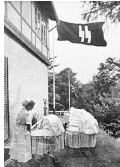
Figuur 2. Het Lebensborn programma in actie

Om ten gronde te begrijpen wat Hitler echt dacht over het Christendom, moet men onderzoeken wat hij privé zei tot zijn stafleden. Alan Bullock citeert Hitler als dat hij christenen “vuile reptielen” noemt die gebruik maken van Duitslands zwakheid, en dat zij door Joden uitgevonden sprookjes imiteren (p. 303). Historicus George Constable wijst erop dat Hitler privé zei dat hij uiteindelijk het Christendom in Duitsland zou willen uitroeien, met “wortel en tak” (pp. 13–14). Hitler zij eens: “Ikzelf ben een heiden tot in de kern” (p. 57). Tot zover de mythe dat Hitler op enige manier, gedaante of vorm een christen was.