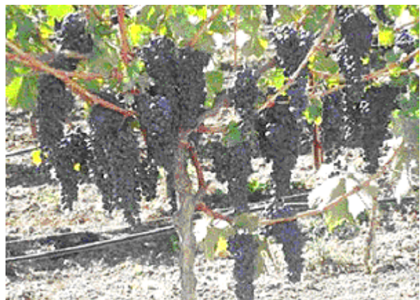
Een wijnstok met vruchtbare ranken!

In Johannes hoofdstuk 15 vinden we een ander belangrijk vers dat begint met de woorden “IK BEN”. In Johannes 15:1 zei Jezus: “IK BEN de ware Wijnstok en Mijn Vader is de Wijngaardener”. Jezus sprak deze woorden tot Zijn discipelen. Hij wilde dat zij wisten dat Hij de WIJNSTOK is. Wie zei Jezus dat de ranken zijn (Johannes 15:5)? Jezus’ discipelen! Jezus wilde Zijn discipelen het belang leren van kort bij Hem te blijven. Een rank moet verbonden blijven met zijn wijnstok want anders “ VERDORT ” hij (Johannes 15:6). Alle levenssappen vloeien van de wijnstok naar de ranken, maar dat gebeurt enkel wanneer de ranken verbonden blijven met de wijnstok. Als een rank loskomt van de wijnstok, zal hij afgesloten worden van de bron van LEVEN en zal er geen vrucht ontstaan.