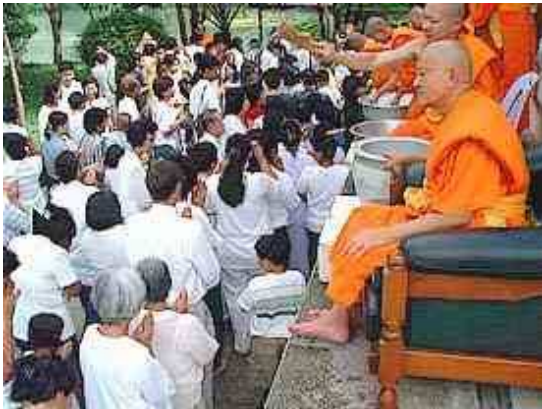
Heilig water sprenkeling bij Boeddhisten