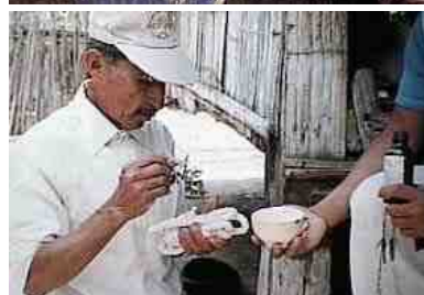
Hier wordt zelfs een touw 'gezegend' met heilig water (Guanga- la-Chili)