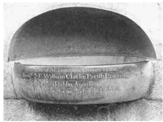
Bij de ingang van elke kerk