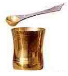
Rechts hetzelfde maar dan voor gebruik in het Hindoeïsme

Heilig water sprenkelen/drinken/inwrijven is een gebruik dat door de Roomse kerk, en haar Orthodoxe broeders, gekopieerd en geadopteerd werd van het aloude afgodische heidendom. Tegenwoordig nog steeds in gebruik bij o.a. Boeddhisten en Hindoes, zoals de beelden hierna bewijzen.