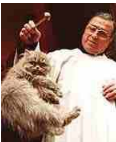
Hier wordt een kat besprenkeld