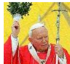
Ook de paus sprenkelt gewijd water

En vanalles-en-nog-wat wordt er besprenkeld door de zogenaamde 'christelijke' kerken