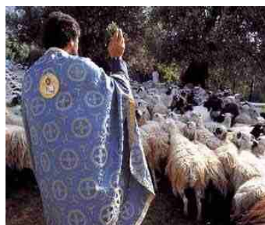
Wijwater kan ook over de schapen ge- sprenkeld worden