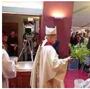
Met bladertakken, kwast of sprenkelaar ...