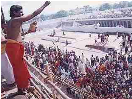
Heilig water wordt over Hindoes gesprenkeld