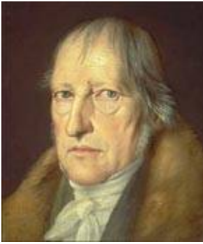
Georg Wilhelm Friedrich Hegel 1770-1831