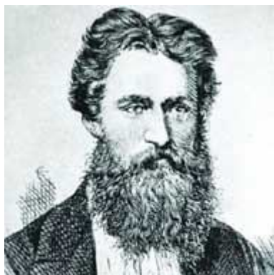
Figuur 2. De Assyrioloog George Smith 3 (1840–1876) die eerst het Gilgamesj-epos ontdekte en vertaalde. Smith was een bijbelgelovige christen die werkte aan het British Museum. Voor hij stierf op de leeftijd van 36 jaar, was hij gestart met het informeren van het publiek over de vele oude documenten die de historiciteit van Genesis bevestigen.

Zoals met de vloedlegenden is er een overvloed aan getuigenissen, van over de hele wereld, over het bouwen van een grote toren en de daarop volgende taalverwarring in Babel. Onder de oudere verslagen is er een gevonden in het Sumerische epos: Enmerkar en de heer van Aratta , dat samengesteld zou zijn ronde de 21 ste eeuw v.C.. Het verwijst naar de aanbidding van een hoofdgodheid “Enlil” en spreekt van een tijd toen “het hele universum ... tot Enlil badt in één taal” (p. 71). Een ander oud verslag is gevonden op een tablet dat ontdekt en vertaald werd door de christelijke Assyrioloog George Smith (figuur 2) in 1875. Een 7 de eeuwse (v.C.) kopie van een ouder document, beschrijft de zonde van hen die de toren bouwden en hoe de “vader van alle goden” hen oordeelde door hun werk te verijdelen en hun taal te verwarren (pp. 72–73). Gelijkaardige verslagen zijn gerelateerd aan de Grieken en Romeinen, inbegrepen één van Hestiaeus van Perinthus, een pupil van Plato (p. 70).