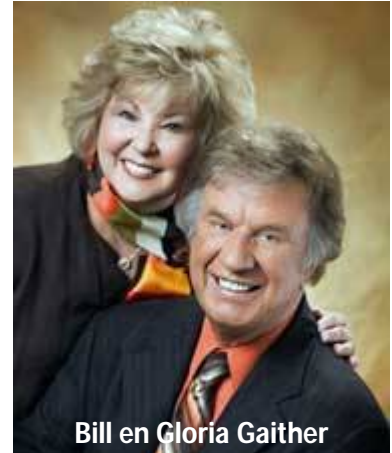
Bill en Gloria Gaither