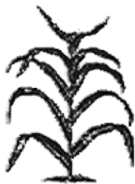
Rotsige bodem (vers 6)

6. LUKAS 8:4-15. Wat is het ene ding dat GELIJK is bij het zaad dat viel op de rotsige bodem en het zaad dat viel in goede aarde (vergelijk vers 6 en vers 8)? Ze groeiden allebei op .