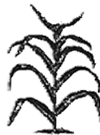
Goede aarde (vers 8)

Als u zou lopen langs deze twee opgroeiende planten (de ene op rotsige grond en de andere op goede grond) zou u dan op het eerste zicht enig verschil merken? Nee. Welk ene ding is noodzakelijk voordat u het verschil zou kunnen noemen: