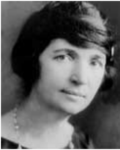
Sanger in 1922

ductie door de beroemde Britse novellist en eugeneticus H.G. Wells, die zei: ‘We willen minder en minder kinderen ... we kunnen niet het sociale leven en de wereldvrede die we besloten hebben na te streven, realiseren met de ongemaneerde en slechtgeschoolde zwermen van inferieure burgers die u aan ons opdringt’” (Black, pp. 127, 129, 130).