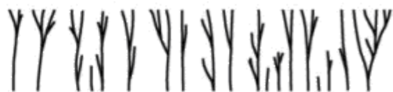
De creationistische levens-“boomgaard”

Een onpersoonlijke oorsprong van alle soorten leven door toeval