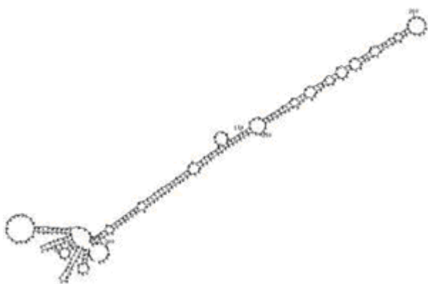
Een voorbeeld van microRNA

Margulis werd beroemd door het voorstellen van een radicaal andere opvatting van taxonomie dan alles wat er voordien geweest was. Zij stelde voor dat complexere cellen ontstaan zijn door het verzwelgen van de meer eenvoudige cellen. [5] 4 Uiteindelijk werden haar ideeën de heersende stroming.