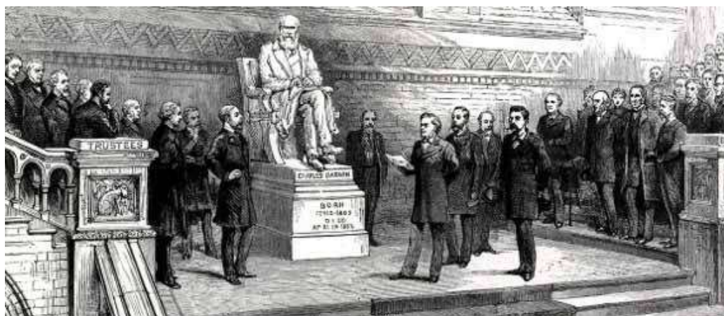
Afgodsbeeld van Darwin in het National History Museum in Londen. Darwinisme is religie met Darwin als hun god!