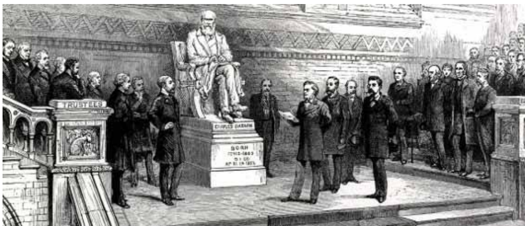
Afgodsbeeld van Darwin in het National History Museum in Londen. Darwinisme is religie met Darwin als hun god!