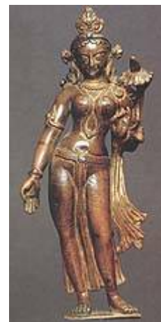
Tara van Tibet-Nepal

In aanmerking genomen dat er veel verschillen zijn, delen alle religies van de wereld (behalve het bijbelse Christendom, dat geen religie is) 6 eenzelfde fundamenteel principe: redding (of zijn equivalent, b.v. het bereiken van het nirvana, het paradijs, moksha, het hogere hiernabestaan, enz.), wordt verworven door menselijke prestatie. Dit is heel duidelijk in alle verschillende pogingen van bevredigen, tevreden stellen, verzoenen, sussen, de wraak tegenhouden, één worden met, of het bereiken van God, Brahman, Allah, allerlei goden, allerlei godinnen, de Koningin des Hemels, de Kracht, de Universele Geest, enz.