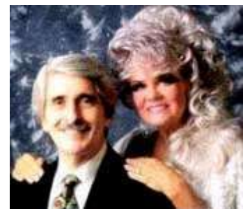
Paul & Jan Crouch

► CCC heeft ook een alliantie gesmeed met het godslasterlijke, charismatische Trinity Broadcasting Network (TBN), in eigendom van en geleid door Paul en Jan Crouch. De TBN-nieuwsbrief stelt: “Het opwindende nieuws is dat Dr. Bill Bright van Campus Crusade for Christ een team gestationeerd heeft in El Salvador, gereed voor de productie van Spaanstalige christelijke programma’s. Zij HOUDEN VAN de gezalfde Divine Healing diensten daar. Het Lichaam van Christus komt samen in El Salvador -- niet-katholieken en katholieken HOUDEN VAN christelijke Tv en mensen van overal in El Salvador komen tot Jezus!” (Verslag in de Calvary Contender , 15-2-1991).