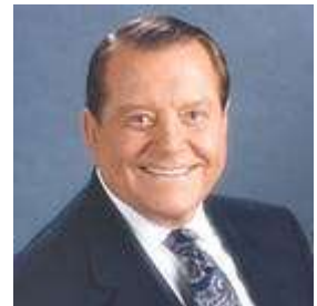
Bill Bright, 1921-2003