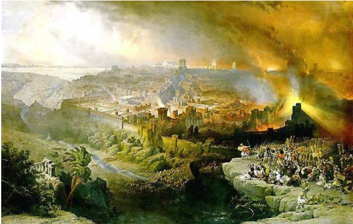
“Zijn bloed kome over ons, en over onze kinderen!” - Mattheüs 27:25 De belegering van Jeruzalem door generaal Titus in 66-70 n.C.

Alle pogingen van Pilatus om Jezus vrij te laten faalden (lees Johannes 19:8-16). Tenslotte, in zijn zwakheid en lafhartigheid, was alles wat hij kon doen zijn handen wassen (Mattheüs 27:24) en Hem overleveren om gekruisigd te worden. Wie droeg de volle verantwoordelijkheid voor deze MISDAAD ALLER MISDADEN (Mattheüs 27:25)? “ al het volk antwoordde en zei: Zijn bloed kome over ons, en over onze kinderen!”