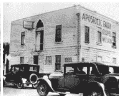
Azusa Street Mission

Tegen de late 19 de eeuw was de weg bereid voor de geboorte van het Pentecostalisme of de Pinksterbeweging.