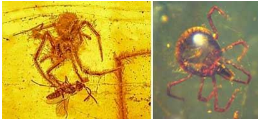
Links: Aanvallende spin in amber ( http://digitaljournal.com/article/334727 ). Rechts: Teek in amber. Plaatje: Oregon State University.

Zoals de bloem hierboven genoemd, hebben verscheidene insectvariëteiten geen gekend levende vertegenwoordiger, zodat ze waarschijnlijk uitgestorven raakten. Maar uitsterving verwijdert levensvormen terwijl evolutie verondersteld wordt ze uit te vinden , en dus biedt hun afwezigheid geen steun aan een evolutionaire levensgeschiedenis.