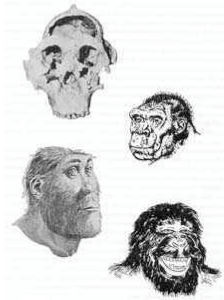
Drie reconstructies van de Zinjanthropus